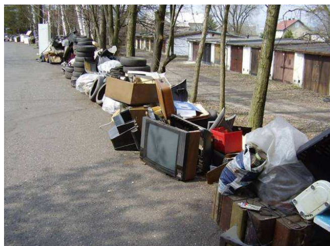
Takto si občané Nového Sedla představují svoz nebezpečného odpadu S přicházejícím jarem se provádí velký úklid a bohužel je vidět.

Jako nebezpečný označujeme takový odpad, který vykazuje jednu nebo více z níže uvedených vlastností: Výbušnost, oxidační schopnost, vysoká hořlavost, dráždivost, škodlivost zdraví, toxicita, karcinogenita, žíravost, infekčnost, teratogenita, mutagenita, schopnost uvolňovat vysoce toxické nebo toxické plyny ve styku s vodou, vzduchem nebo kyselinami, schopnost uvolňovat nebezpečné látky do životního prostředí při odstraňování, ekotoxicita Mezi nebezpečný odpad patří: Syntetické barvy, laky, syntetická ředidla, mořidla, elektrické baterie, autobaterie, oleje, tuky minerální nebo syntetické,