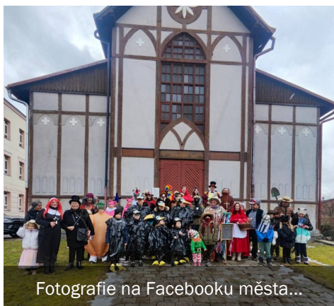
Fotografie na Facebooku města...

Ulice města zaplnil pestrý průvod masek, který se po loňské premiéře stal oblíbenou tradicí. Masky vyrazily od kostela