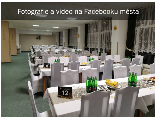
Fotografie a video na Facebooku města

Na školní ples navázal 24. ročník plesu města , který se nesl v duchu elegance a příjemných novinek. K tanci a poslechu hrála kapela Griff Band , která opět sklidila pozitivní ohlas a dokázala udržet tanečnický na parketu až do pozdních nočních hodin.