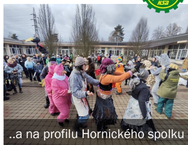
..a na profilu Hornického spolku

směrem k městskému náměstíčku u městského úřadu, kde na návštěvníky čekaly zabijačkové dobroty, soutěž o nejhezčí kostým i společná zábava.