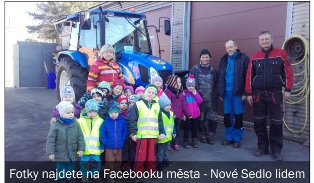
Fotky najdete na Facebooku města - Nové Sedlo lidem