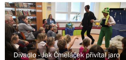
Divadlo - Jak Čmeláček přivítal jaro