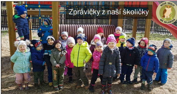
Zprávičky z naší školičky