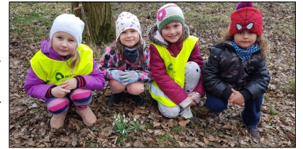
Děti a zaměstnankyně MŠ Sklářská

Proběhly karnevaly a děti i školka se těší na jaro. Venku rozkvetly první jarní kytičky a objevily se na stromech pupence a kočičky. Třída malých dětí začala sérii 10 pobytů v solné jeskyni. Třída velkých dětí vyrobila Morénu a zajela do Lokte k řece, aby se za nás všechny rozloučila se zimou. Děti čeká další divadelní představení a všichni se začneme chystat na Velikonoce. Přijeme všem krásné jarní dny.